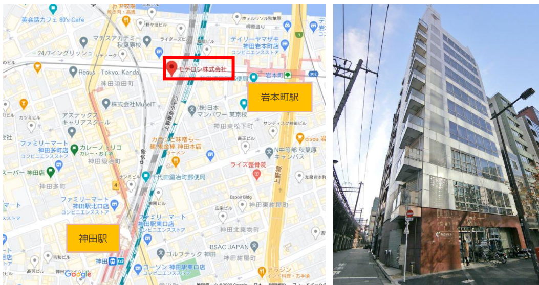
オフィス所在地（左）およびビル外観（右）